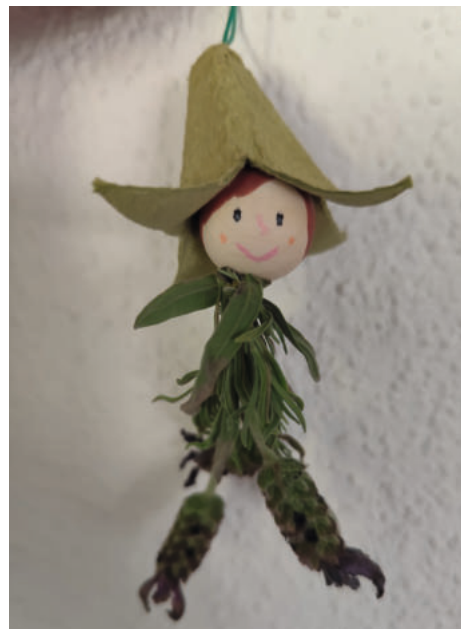
Eine kleine Fee aus Eierkarton und Lavendel, angefertigt nach der Bastelanleitung im Buch.