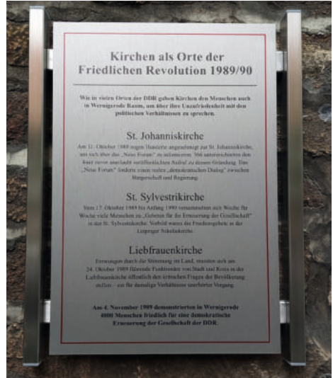
Die Gedenktafel am Südeingang von St. Sylvestri