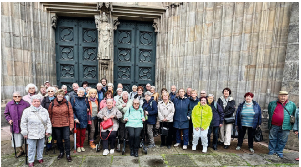
Die Teilnehmer der Gemeindefahrt vor dem Magdeburger Dom