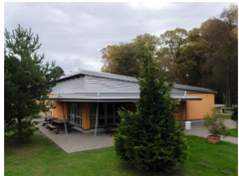
Die Unterkunft „Haus Grillensee“