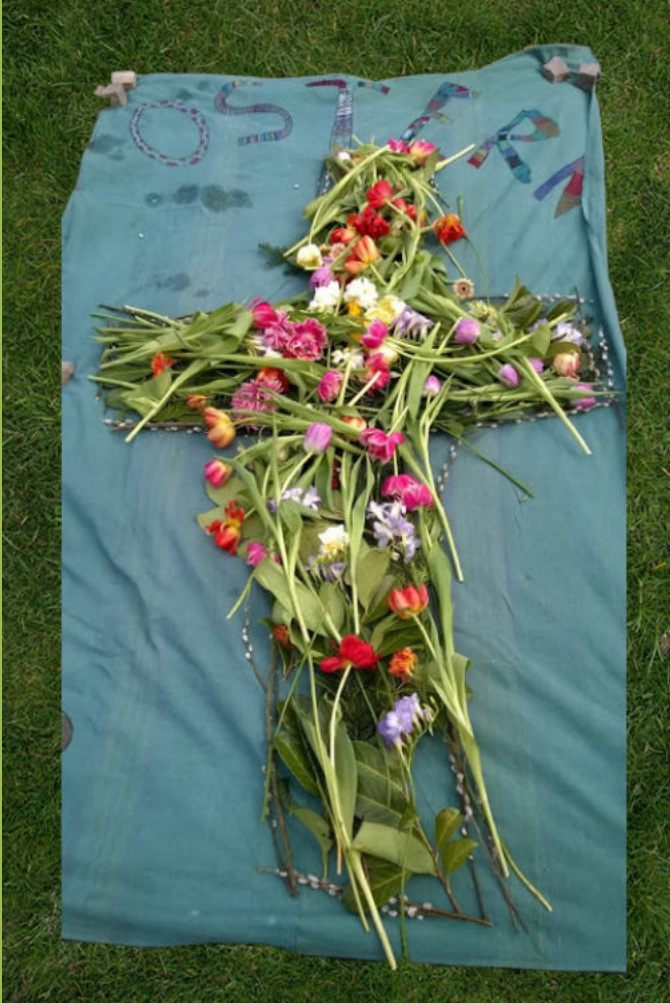
Kreuz aus Blumen vom Osterweg der Kinder

Hart auf deiner Schulter lag das Kreuz, O Herr, ward zum Baum des Lebens , ist von Früchten schwer. Kyrie eleison, sieh, wohin wir gehen. Ruf uns aus den Toten, lass uns auferstehn .