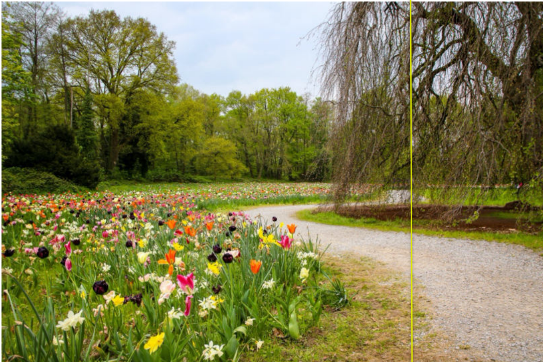
Motiv des Liedblattes vom Festgottesdienst am 5. Januar 2020